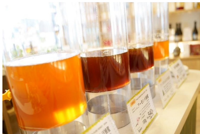
参考：ミールミィ三条本店のはちみつ量り売り