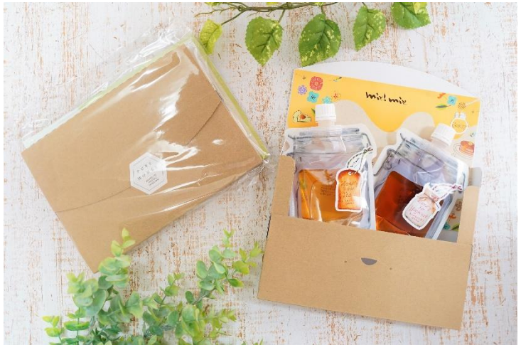
ポストに届くメール便イメージ