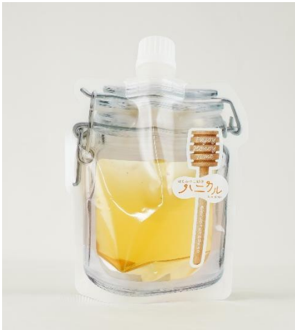
あなたにぴったりのはちみつイメージ